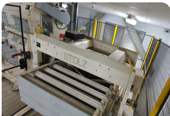
Sélecteur automatique de grilles autonomes

Mais surtout il permet un contrôle intégral de la machine, un pilotage à distance et un réglage rapide des paramètres.