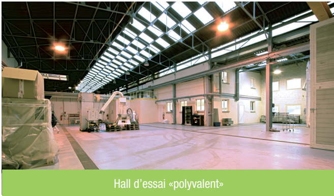
Hall d'essai «polyvalent»