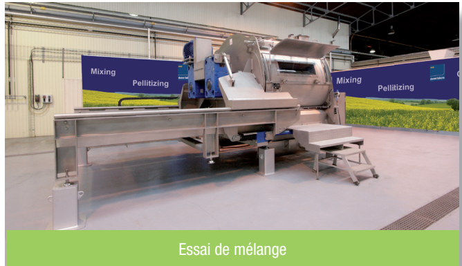
Essai de mélange